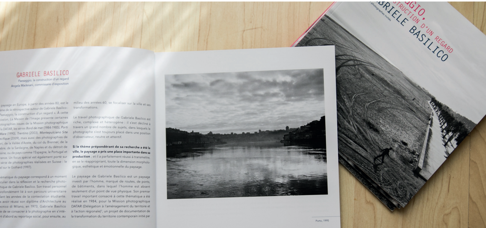
catalogue d'exposition 2016

Comme chaque année, la Maison de l'Image édite un catalogue regroupant tous les photographes participant à cette exposition. Quatre pages par photographe seront dédiées aux talents émergents pour mettre en valeur leurs regards singuliers et garder une trace de cette exposition.